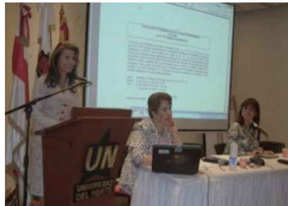
Primer día de sesión del Consejo de Directoras en la Universidad del Norte en Barranquilla