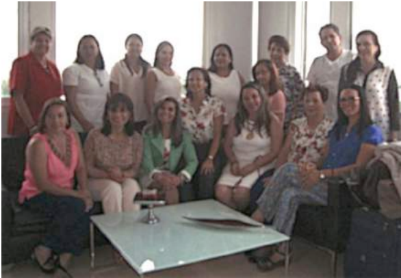
Junta Directiva ACOFAEN y Docentes Programa de Enfermería Universidad Simón Bolívar - Barranquilla

La Junta Directiva y los miembros Ejecutivos y Administrativos de ACOFAEN, sesionaron el 27 de octubre en las instalaciones de la Universidad Simón Bolívar de Barranquilla – Atlántico, allí se realizó un encuentro con profesoras de la Facultad de Enfermería de esta institución, donde se analizaron temas sobre la certificación, y sobre las necesidades de formación y desarrollo profesional.