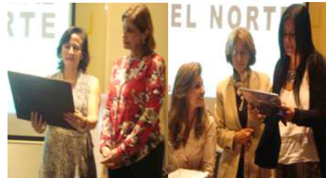
Universidad del Norte