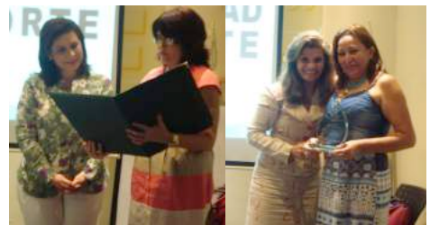
Pontificia Universidad Javeriana