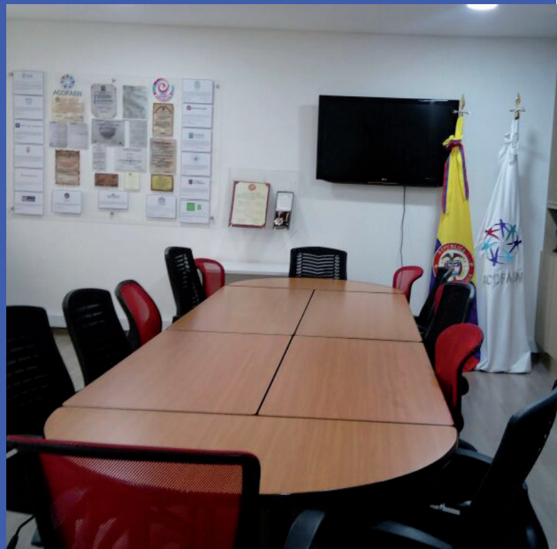
Sede Asociación Colombiana de Facultades y Escuelas de Enfermería - Acofaen